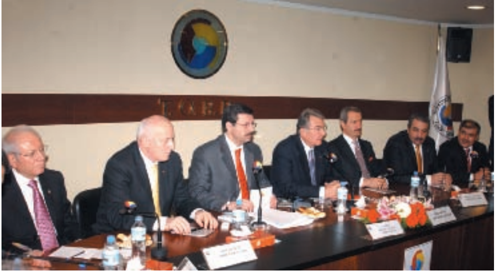
TOBB 2006 yılı ilk Yönetim Kurulu Toplantısı CHP Genel Başkanı Deniz Baykal'ın Katılımıyla Gerçekleştirildi

TOBB Başkanı M. Rifat Hisarcıklıoğlu: “Bizim görevimiz, kendi doğrularımız, kendi tabanımız ve Anayasa'nın bize verdiği yetki çerçevesinde üyelerimizin hak ve hukukunu korumaktır. Bizim meselemiz budur. Bizim tek siyasetimiz var: Ekonomi siyaseti” dedi. 16.01.2005