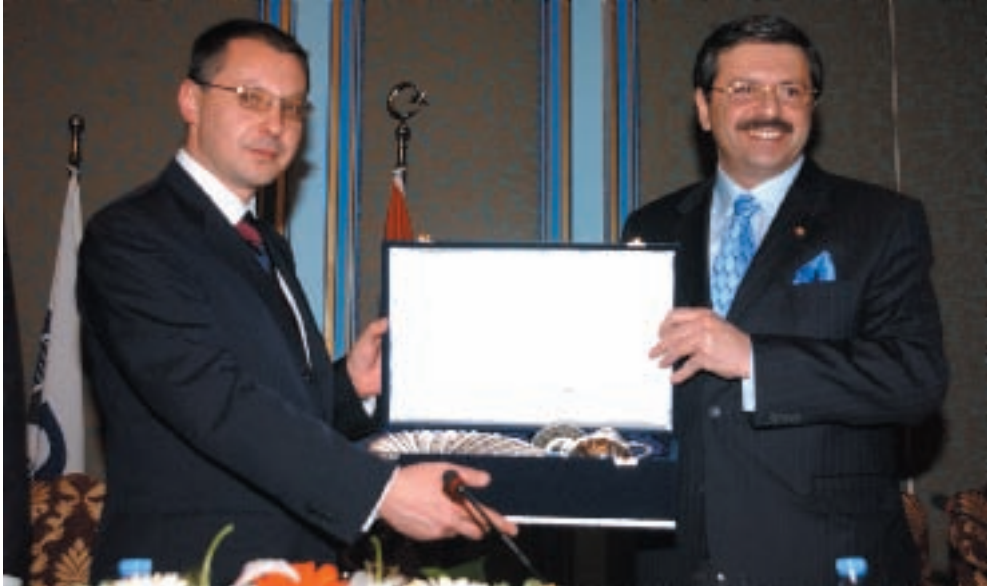
Bulgaristan Başbakanı Sergei Stanishev İstanbul'da: Dış Ekonomik İlişkiler Kurulu (DEİK) tarafından düzenlenen Türk-Bulgar İş Konseyi Toplantısı, Çırağan Sarayı'nda gerçekleştirildi. Toplantıya, Başbakan Recep Tayyip Erdoğan'ın resmi davetlisi olarak Türkiye'ye gelen Bulgaristan Başbakanı Sergei Stanishev, Devlet Bakanı Kürşad Tüzmen, Türkiye Odalar ve Borsalar Birliği ve DEİK

TOBB Başkanı M. Rifat Hisarcıklıoğlu: “Bizim görevimiz, kendi doğrularımız, kendi tabanımız ve Anayasa'nın bize verdiği yetki çerçevesinde üyelerimizin hak ve hukukunu korumaktır. Bizim meselemiz budur. Bizim tek siyasetimiz var: Ekonomi siyaseti” dedi. 16.01.2005