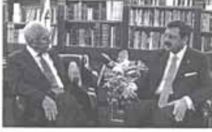
TOBB Başkanı Rifat Hisarcıklıoğlu, Başkan Yardımcısı Halim Mete ile İsrail Cumhurbaşkanı Şimon Peres'in TOBB başkan yardımcılığı için destek talebinde bulundu. İsrail Cumhurbaşkanı Şimon Peres, yeni yıldan önce projeye start vermek istediklerini ve bu konuda önceliğin Türk tarafında olduğunu da ifade etti. KUDÜS AA

Hisarcıklıoğlu ve Mete, İsrail Cumhurbaşkanı Şimon Peres tarafından kabul edildi. İsrail Cumhurbaşkanı Peres'in, Hisarcıklıoğlu ve Mete'yi Kudüs'te Cumhurbaşkanlığı'nda kabulü hususuna kapalı yapıldı. Edinilen bilgiye göre toplantı gayet sıcak bir atmosferde gerçekleşti ve Peres, Filistin Yönetimi ekonomisinin güçlendirilmesi için çaba gösterdiklerini ve bunun da bölgenin yararına olacağını ifade etti. Peres, Türk tarafından, Cenin'deki organize sanayi projesini yapmalarını istedi, bunu hem kendisi hem de İsrail hükümeti adına söylediğini vurguladı. İsrail Cumhurbaşkanı, Türkiye ve İsrail, hem demokratik hem de piyasa ekonomisine bağlı ülkeler olarak, Ortadoğu'daki diğer ülkelere de örnek olabilir.