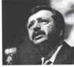
1. Genç Girişimciler Kurulu Kongresinde konuşan TOBB Başkanı Rifat Hisarcıkloğlu, genç girişimcilere yönelik önemli mesajları söyledi.

Sanayi ve Ticaret Bakanı Nihat Ergün de bu yıl "Teknoloji Sermayesi Desteği" adı altında genç girişimcilere yönelik çok önemli bir proje başlattıklarını ifade ederek, "Teknolojik ve yenilikçi fikri olan gençlerimize keşifsiz, karşılıksız, geri ödemesiz 100 bin liraya kadar hibe desteği sağlıyoruz" dedi. Ergün, Nisan ayından bugüne kadar yapılan 159 başvurudan 78'inin uygun bulunduğunu aktardı. TOBB Genç Girişimciler Kurulu Başkanı Ali Sabancı da 81 ilin 78'inde teşkilatlandıklarını ve 1500'ü aşkın üyelerinin bulunduğunu dile getirdi. Türkiye'de 100 kişiden sadece 6'sının girişimci olduğunu bildiren Sabancı, erkek girişimci sayısı 1.3 milyon iken kadın girişimci sayısının ise 80 bin düzeyinde kaldığını vurguladı.