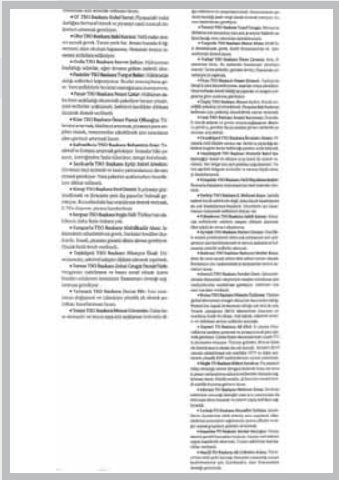
DÜNYA GAZETESİ - 02 MAYIS 2009