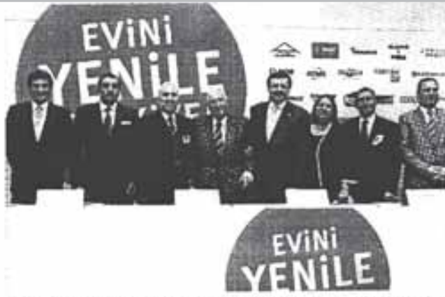
Türkiye Odalar ve Borsalar Birliği'nin öncülük ettiği son kampanya, Halkbank ve yapı malzemeleri sektörü işbirliği ile dün başlayan "Evini Yenile Türkiye" oldu.

Sözün özü, Türkiye kendi iç dinamikleri ile krizden çıkmaya çalıştı ve bunu da yavaş yavaş başarıyor.