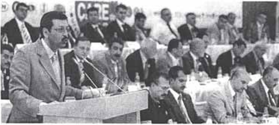
'Kriz varsa çare de var' kampanyası kapsamında 'Üreten Türkiye Platformu' üyesi kuruluşların başkanları, Adıyaman'da bir araya geldi. TOBB Başkanı Rifat Hisarcıklıoğlu, hükümetin karşı çıktığı harcama çeki talebini yineledi.