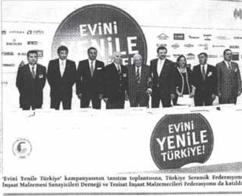
'Evini Yenile Türkiye' kampanyasının tanıtım toplantısına, Türkiye Seramik Federasyonu, İnşaat Malzemesi Sanayicileri Derneği ve Tesisat İnşaat Malzemecileri Federasyonu da katıldı.

Yapı sektörü, Halkbank ve TOBB'la birlikte 'Evini Yenile Türkiye' kampanyası başlatıyor. Üç ay sürecek kampanyayla, 100 bin tüketiciye yüzde 0.33'ten başlayan faiz oranlarıyla kredi verilmesi ve sektörde 1 milyar TL'lik iş hacmi hedefleniyor