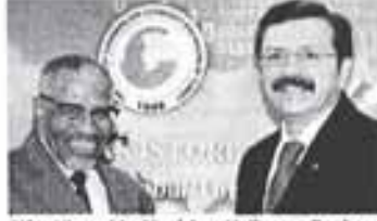
Rifat Hisarcıkıoğlu, İslam Kalkınma Bankası Başkanı Ahmed Muhammed Ali ile görüştü.

■ Reel sektöre yönelik İslami finans ve bankacılık sisteminin geliştirilmesi