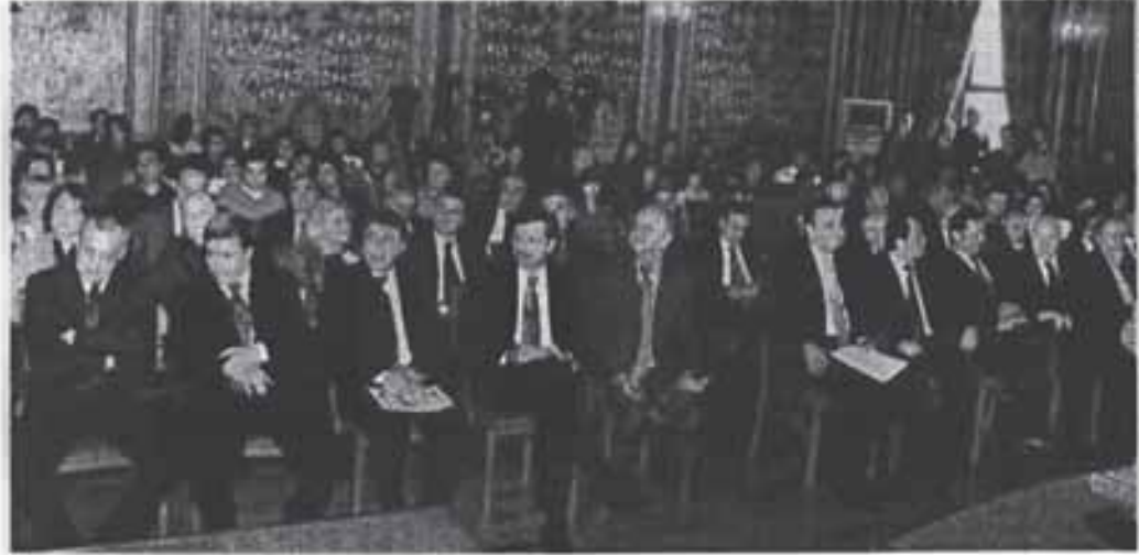
Istanbul Üniversitesi İktisat Fakültesi Mecazlar Cemiyeti tarafından bu yıl 35'inci düzenlenen İktisatçılar Haftası'na ekonominin dende getiren temsilcileri katıldı.

2009 yılına yönelik harcama artırıcı tedbirlerin kaçınılmaz olduğunu söyleyen TOBB Başkanı Rifat Hisarcıklioğlu, "2010 ve sonrası için mali disiplinin yeniden tesis edileceği garanti altına alınmalı. Aksi halde kamu borçlanmasının mali piyasalar üzerindeki daraltıcı etkisinin önünü alamayız" diye konuştu. Orta vadeli mali programa ihtiyaç duyulduğunu belirten Hisarcıklioğlu, "Olursa Türkiye kontrollü bir küçülme yaşar ve sonrasında küresel yarışa en az üretim ve istihdam kaybıyla devam eder. Olmaz ise unutmak istediğimiz 90'lı yılları yeniden yaşarız" dedi. ➤ Sayfa 7