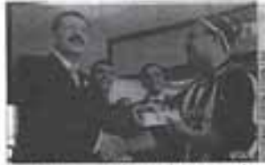
TOBB, dün Forum Ankara Outlet AVM'ye gelen ilk 100 müşteriye 50'er TL hediye çeki dağıttı.