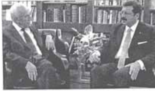
Şimon Peres (Solda) ve Rifat Hisarcıklıoğlu arasındaki görüşme sıcak bir ortamda geçti.