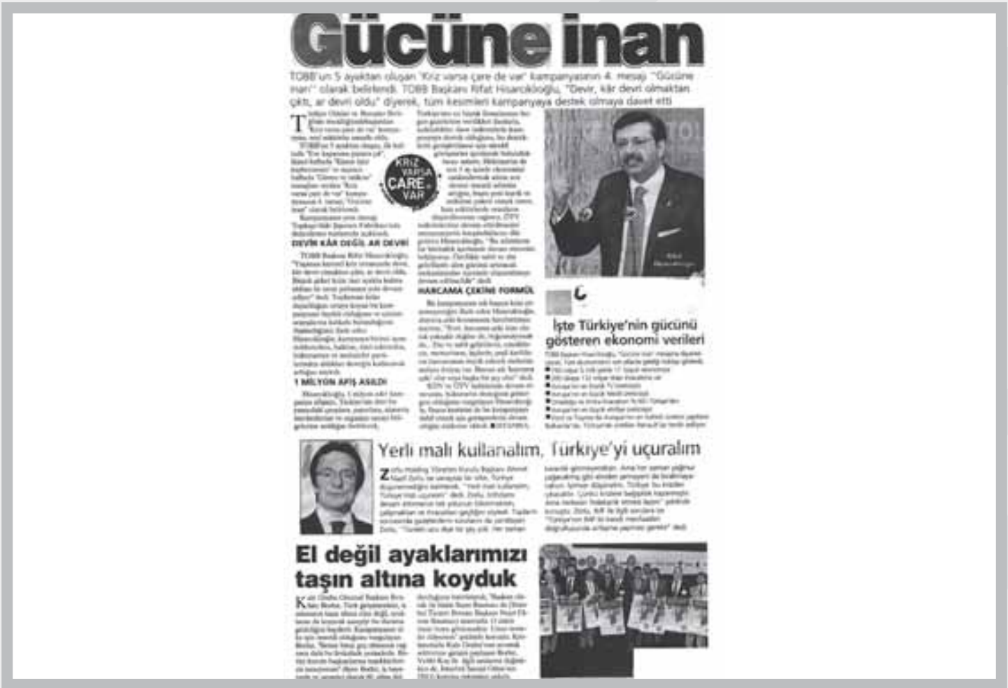
YENİ ŞAFAK GAZETESİ - 23 HAZİRAN 2009