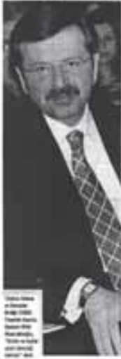
Rifat Hisarcıklıoğlu TOBB Yönetim Kurulu Başkanı

Orta vadeli mali programa ihtiyaç olduğunu ifade eden Türkiye Odalar ve Borsalar Birliği (TOBB) Yönetim Kurulu Başkanı Rifat Hisarcıklıoğlu, "Bunlar olursa Türkiye kontrollü bir küçülme yaşar ve sonrasında küresel yarışa en az üretim ve istihdam kaybıyla devam eder. Olmaz ise unutmak istediğimiz 90T'ı yıllan yeniden yasarız" dedi. 3 temel amaç etrafında Çalışmanın önemine işaret eden Hisarcıklıoğlu, canlandırma tedbirlerine, tüketimi desteklemeye önem verilmesi gerektiğini de söyledi. Hisarcıklıoğlu, İstanbul Üniversitesi İktisat Fakültesi Mezunları Cemiyeti tarafından bu yıl 33.'sü düzenlenen İktisatçılar Haftasının açılışında, dünyanın her tarafında krizin etkilerinin derinleştiğini, 2. Dünya Savaşı sonrası oluşturulan düzenin, bugünkü dünyanın ihtiyaçlarına cevap veremediğini söyledi. Bütün ülkelerde ekonomiye duyulan güvenin büyük ölçüde sarsıldığına işaret eden Hisarcıklıoğlu, "Dünya ilk defa böyle ağır bir krizle karşı karşıya bulunmaktadır. Krizin ne kadar uzun süreceği ise henüz belirsizdir" dedi. Geçtiğimiz haftalarda eski İngiltere Başbakanı Tony Blair ve Avrupa Merkez Bankası Başkanı ile görüşmelerinden örnekler anlatan Hisarcıklıoğlu, şunları kaydetti: "Ben onları dinledikten sonra sonra bu krizi, herhalde dünya şu anda haritası çıkarılmamış topraklardan geçiyor diye tanımlıyorum. Yani buradan Ankara'ya gitmek