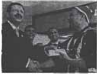
Vatandaşlara çek dağıtan TOBB Başkanı Rifat Hisarcıklıoğlu, Forum Ankara'ya "tulumbaya su döktüğü" için kutladı.