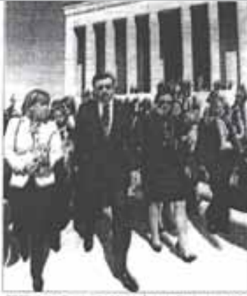
TOBB Kadın Girişimciler Kurulu İstişare Toplantısı nedeniyle TOBB Yönetim Kurulu Başkanı Rifat Hisarcıklıoğlu ile TOBB Kadın Girişimciler Kurulu Başkanı Aynur Bektaş ve beraberindekiler Anıtkabiri ziyaret etti.