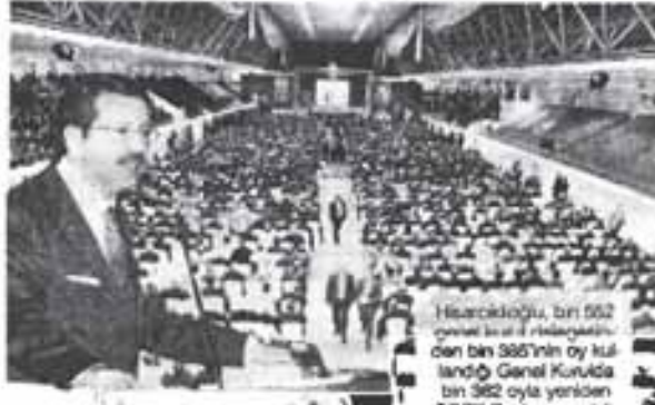
Hisarcıklıoğlu, bin 562 oy ile 3. turda seçildi. Bin 385'in oy kullandığı Genel Kurulda bin 382 oyla yeniden TOBB Başkanı seçildi.

Başbakan Recep Tayyip Erdoğan, CHP Genel Başkanı Deniz Baykal, bakanlar ve TOBB delegelerinin de katıldığı Genel Kurulda "Kriz muhasebe yapma zamanıdır" sözleriyle konuşmasına başlayan Hisarcıklıoğlu, hükümete uyan dolu konuşmasında şunları kaydetti: "Türkiye'nin gerçek gündemine dönmesini ekonomiye odaklanmasına ciddi tedbirlerin alınmasını istiyoruz. Vakit çözüm üretme zamanıdır. Ortak çıkar ortak akıl ile hareket etmeliyiz. Ekonomi geri planda kaldı. Küresel krizle büyüme ağır bir küçülmeye dönüştü. İtiraf edelim ki 2007'den itibaren uzlaşmaya odaklanmadık. Her 4 makineden biri sustu. Küresel kriz bizi düzensizde başlasa da Türkiye bu krizden etkilenmedi" şeklinde konuştu.