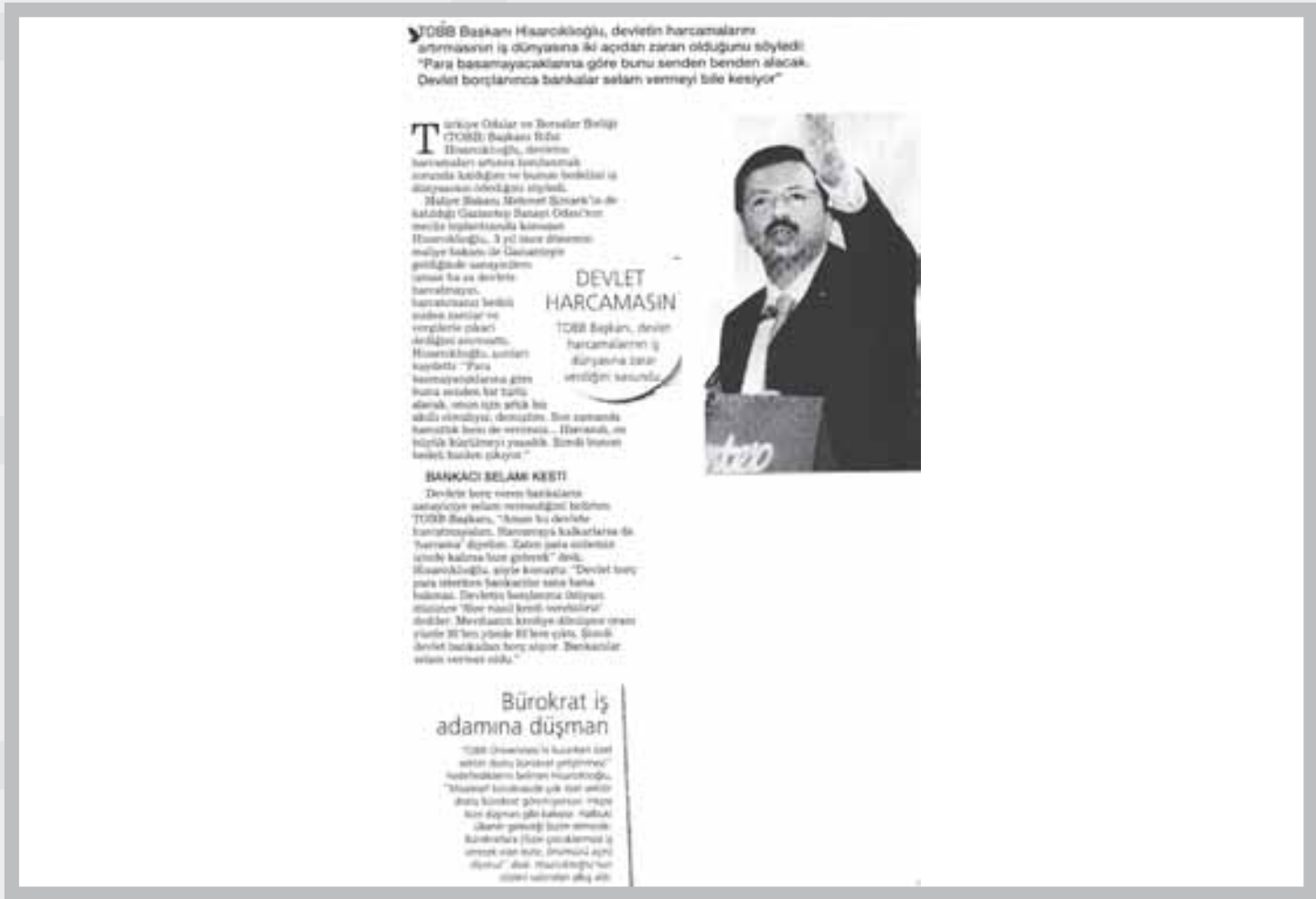
HABERTÜRK EKONOMİ GAZETESİ - 24 TEMMUZ 2009