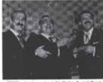
TOBB'un bugün yapılacak 64. Olağan Seçimli Genel Kurulu öncesinde, üyelerden 10 yıl ve daha üzeri süreyle genel kurul delegesi olanlara plaket verildi.