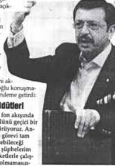
TOBB Başkanı, "Ticaret kolaylaştırılmaya yönelik programların geliştirilmesine ihtiyaç vardır" dedi

RIFAT Hisarcıkloğlu şunları söyledi: "Türkiye'de biz de krizin etkilerini hissediyoruz. Türkiye Merkez Bankası, yakın bir tarihte mali sektöre nakit akışı sağlamaya başlamıştır. Fakat kredi kanallarının daha işlevsel çalışmasına dönük sıkıntılar mevcuttur. Bu sebepten, hükümet kredi mekanizmasını yeniden doğru işler hale getirebilmek için Kredi Garanti Mekanizması (Loan Guarantee Mechanism) üzerinde çalışmaktadır. Hükümet kısa bir süre önce, emlak, beyaz eşya ve otomotiv sektörünü canlandırmayı amaçlayan vergi teşvikleri uygulamaya başladı. Türkiye gibi ülkelerde başlıca mesele, uluslararası fon akışında görülen düşüştür. İkinci husus ise, küresel ticaret finansmanıdır."