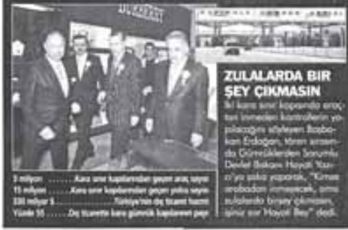
1 milyon ..... Araç geçiş kapasitesi önceki araç geçiş kapasitesine göre 130 kat arttı. 11 milyon ..... Araç geçiş kapasitesi önceki araç geçiş kapasitesine göre 130 kat arttı. 130 milyon ..... Araç geçiş kapasitesi önceki araç geçiş kapasitesine göre 130 kat arttı. Yeni 10 ..... Değeri önceki araç geçiş kapasitesine göre

Kapıkule'nin Türkiye'nin başkentini 4 bu yolla da tüm Avrupa'ya açılan, aynı zamanda dünyanın ikinci, Avrupa'nın en yoğun sınır kapısı konumunda bulunan Kapıkule'nin de en işlek sınır kapısı olduğuna dikkat eden Hisarcıkhoğlu, "Beklenenin