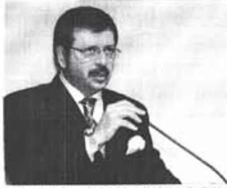
Rifat Hisarcıkloğlu, Türk girişimcilerin Balkanlar'daki toplam yatırımlarının 2 milyar 5, Türk müteahhitlerinin projelerinin de 4.5 milyar 5'a ulaştığını bildirdi.

Avrupa Ticaret ve Sanayi Odaları Birliği (Eurochambres) başkanlık divanı üyesi olarak geçtiğimiz günlerde Makedonya, Karadağ, Sırbistan, Hırvatistan, Bosna Hersek ve İsviçre'yi ziyaret eden TOBB Başkanı Rifat Hisarcıkloğlu, temaslarını değerlendirdi. Balkan ülkelerinde Türk girişimcilerin toplam yatırımlarının 2 milyar dolara ulaştığını hatırlatan Hisarcıkloğlu, Türk müteahhitlik firmalarının 1992 yılından bu yana Balkanlar'daki üstlendikleri projelerin toplamının da 4.5 milyar dolara yükseldiğini kaydetti. TOBB Başkanı, halen yaklaşık 15 bin Türk firması ve 20 bin iş adamının Balkanlar'da faaliyet gösterdiğine işaret etti. Balkan iş dünyası temsilcileri ve hükümet yetkilileri ile bir dizi görüşme yapan Hisarcıkloğlu, iki ülke arasındaki ticari ilişkiler başta olmak üzere, Türk firmalarının piyasaya girme yollarını, özelleştirme alanlarında Türkiye'ye bilgi akışının sağlanması ve bölgesel işbirliklerini ele aldıklarını belirtti.