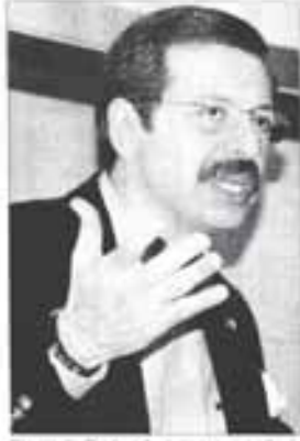
Hisarcıklıoğlu, "Krizden çıkışın anahtarı iç piyasa"