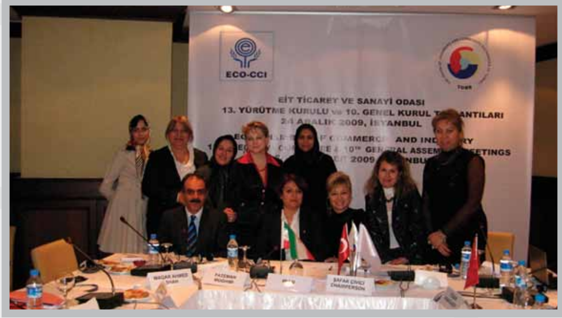
EİT TSO 13. Yürütme Kurulu ve 10. Genel Kurul Toplantıları (24 Aralık 2009)