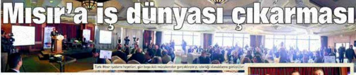
Türk-Mısır işadamları heyetleri, gün boyu iki misal konferans gerçekleştirdi, önemli konularla görüştiler.

Mısır'da Sisi darbesi sonrası Türk-Mısır İş Konseyi Forumu ilk kez toplandı. Mısır Ticaret Odaları Federasyonu Başkanı Al Wakeel, "Ekonomik ilişkimiz, 2007'de kurulan Türk Endüstri Bölgesi ile taçlandı. Şimdi yeniden o günlere dönmeliyiz" dedi