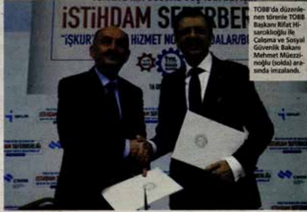
TOBB'da düzenlenen törenle TOBB Başkanı Rifat Hisarcıklioğlu ile Çalışma ve Sosyal Güvenlik Bakanı Mehmet Müezzinoğlu (solda) arasında imzalandı.

Çalışma ve Sosyal Güvenlik Bakanlığı ve İŞKUR ile "Mesleki Eğitim ve İstihdam Seferberliği" başlattıklarını hatırlatan Hisarcıklioğlu, bu seferberliğin Türkiye'de kamu ile özel sektör arasında gerçekleşen en büyük ortak çalışma girişimi olduğunu söyledi. Bakanlık, TOBB ve İŞKUR olarak Türkiye ekonomisinin istihdam dostu büyümesini daha da güçlendirecek yeni bir atılım hamlesi başlattıklarına işaret eden Hisarcıklioğlu, "Artık oda ve borsalar, 81 ü ve 160 ilçede, İŞKUR faaliyetleri hakkında da işverenleri bilgilendirecek ve tanıtacak. Oda ve borsalarımızda İŞKUR hizmet noktaları haline gelecek. Oda ve borsalarımızda İŞKUR'un iş ve meslek danışman-