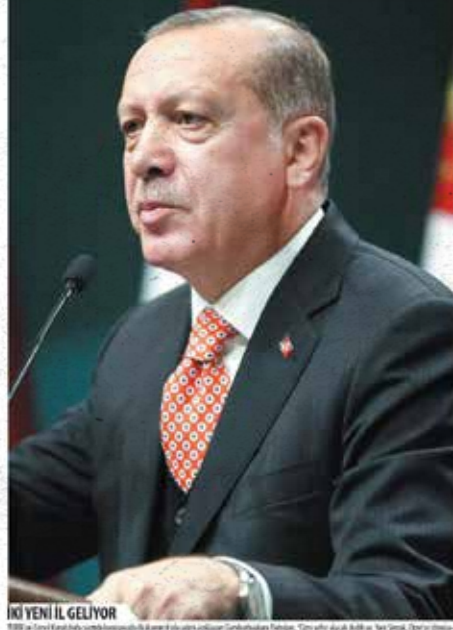
Kİ YENİ İL GELİYOR TOBB Genel Kurulunda konuşan Cumhurbaşkanı Erdoğan, "Yerli otomobil için iş dünyasına çağrıda bulunuyoruz" dedi.

Cumhurbaşkanı Erdoğan iş dünyasına seslenerek, "Gelin şu yüzde yüz yerli otomobilimizi TOBB camiası içerisinde çıkartalım. Biz her an her daim böyle bir konuda yanınızdayız ve önce ülkemize, ardından da tüm dünyaya Türkiye markasını gönderelim" dedi.