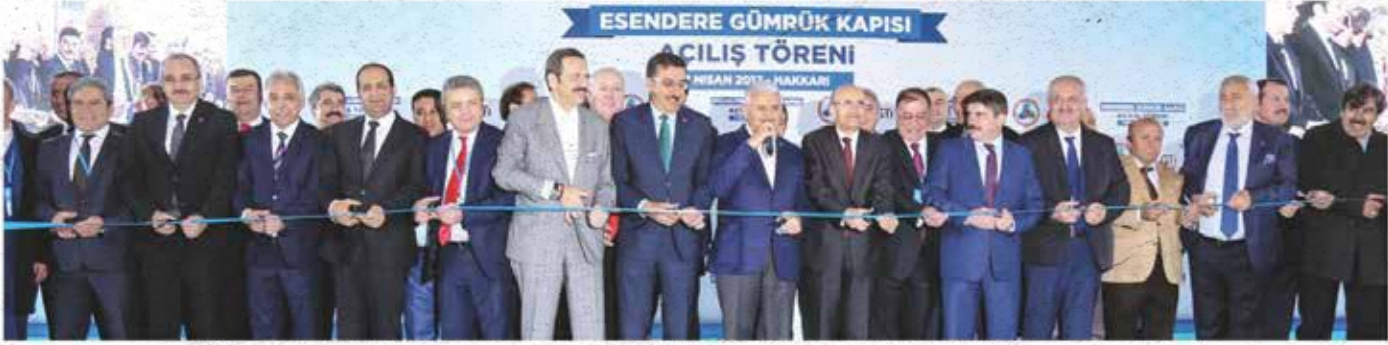
TOBB'a bağlı Gümrük Ticaret İşletmeleri A.Ş tarafından modernize edilen Esendere Gümrük Kapısı'nın açılışını Başbakan Binali Yıldırım ile bakanlar birlikte yaptı.

TOBB'UN öncülüğünde, Gümrük Ticaret İşletmeleri (GTİ) AŞ tarafından modernize edilen Hakkâri-Esendere Gümrük Kapısı, Başbakan Binali Yıldırım, Başbakan Yardımcısı Mehmet Şimşek, Gümrük ve Ticaret Bakanı Bülent Tüfenkci ve TOBB Başkanı Rifat Hisarcıkloğlu'nun katıldığı törenle açıldı. 75 milyon lira yatırım yapılan ve toplam 50 bin metrekare alan üzerinde kurulu yeni Esendere Gümrük Kapısı'nda en son teknoloji x-ray, kamera ve geçiş sistemleri bulunuyor. Törende konuşan Başbakan Yıldırım "Aldığımız kararla gümrük kapılarını yap-ışlet-devret mo-