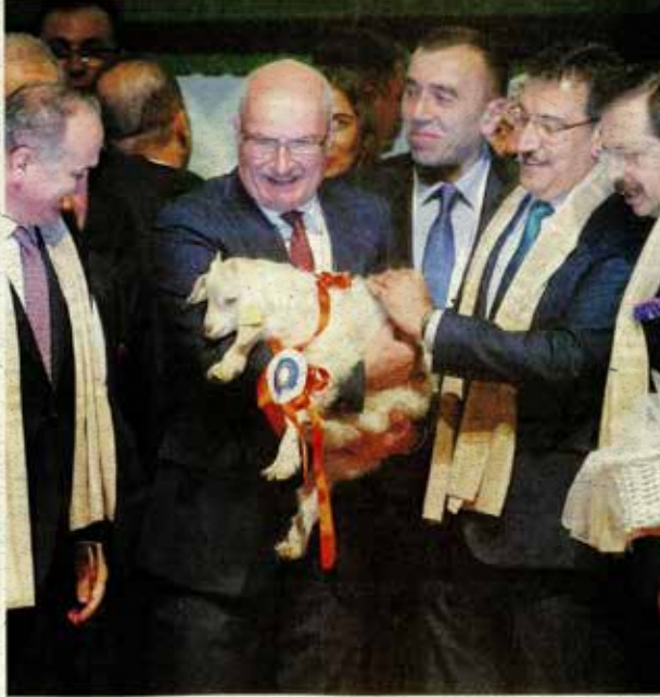
Zirvenin açılışına Ankara Ticaret ve Sanayi Odası Başkanı Hüseyin Çiğdem, Sanayi ve Teknoloji Bakanı Faruk Özlü, Ankara Valisi Ercan Topaca, Türkiye Odalar ve Borsalar Birliği (TOBB) Başkanı Rifat Hisarcıklıoğlu, Ankara Ticaret Odası (ATO) Başkanı Gürsel Baran ve çok sayıda davetli katıldı.

Türkiye Odalar ve Borsalar Birliği (TOBB) Başkanı Rifat Hisarcıklıoğlu, Türkiye'nin her ilçesinin kendine has peyniri olmasına karşın "peynir" denildiğinde akla Fransa'nın geldiğini belirterek, "Bu yüzden yöresel ürünlerimize sahip çıkmak için coğrafi işaret almamız lazım" dedi. ATO Başkanı Gürsel Baran da kırsal kalkınmaya büyük katkıda bulunacağına ve ekonomiye ivme kazandıracağına inandığı zirve boyunca coğrafi işaret konusunun tüm yönleriyle ele alınacağını söyledi. Küresel ölçekte coğrafi işaret ürün pazarının 200 milyar dolarlık büyüklüğe ulaştığını dile getiren Baran, Avrupa Birliği ülkeleri için söz konusu pazarın yaklaşık 55 milyar avro olduğunu kaydetti. Türkiye'de 2 bin 500'ün üzerinde coğrafi işaret alabilecek ürün bulunmasına karşın bunlardan sadece 200'ünün tescillendiğine dikkati çeken Baran, Ankara'yı yöresel ürünler için merkez haline getirmeyi hedeflediğini belirtti.