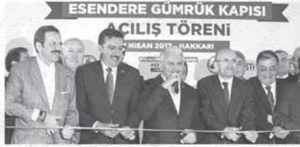
Esendere Gümrük Kapısı, Başbakan Binali Yıldırım'ın katıldığı törenle açıldı.

Hisarcıklıođlu, kapasitesi 2 katına çıkarılan kapının İran'la ticaret hacminin 10 milyar dolardan 30 milyar dolara çıkarılmasında önemli rol oynayacağını söyledi.