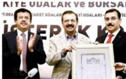
Zeybekci, Tüfenkci ve Hisarcıklıoğlu TOBB Yönetim Kurulu Müşterek Toplantısı'na katıldı.

Gümrük Birliği'nin güncellenmesine ilişkin son olarak 6-7 Temmuz'da görüşmelerini ve sürecin olumlu şekilde sürdüğünü kaydeden Zeybekci, ilk başta dezavantaj gibi görünse de ileride Gümrük Birliği'nin güncellenmesinin Türkiye'nin 2023 hedeflerine hız katacağını söyledi. ■ ANKARA