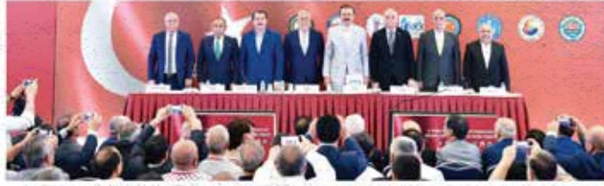
Basın TOBB genel merkezi, 15 Temmuz 2017 tarihinde düzenlenen toplantıda bir araya gelerek konuşuyor. 22 Temmuz'ta gerçekleştirilen toplantıda TOBB Başkanı Adnan Kahraman başkanlığında TOBB üyesi işçi, işveren ve çiftçi örgütleri aynı anda seslendi.