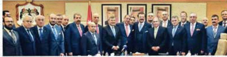
TOBB Başkanı Rifat Hisarcıklioğlu başkanlığında Türk işadamları, Ürdün Başbakanı Al Mülki ile bir araya gelerek ticaretle ilgili konuları görüşti.

ÜRDÜN Ticaret Odası Başkanı Senatör Nael Al Kabariti ise konuşmasında Türk işadamlarına "İkinci evinize hoş geldiniz. Özel sektör olarak yan yana durmalı, Türkiye ile beraber daha fazla iş yapmalıyız" diye seslendi. Rakip değil, ortak olmak gerektiğini anlatan Kabariti, "Ürdün'de büyük imkanlar var. Gelin birlikte iş yapalım. Ürdün güvenli bir ülke" diye konuştu.