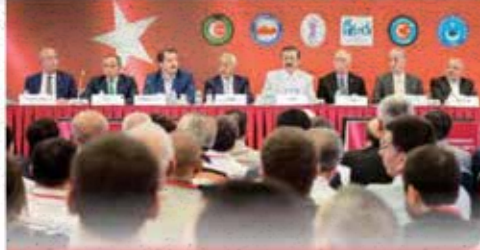
8 sivil toplum kuruluşu başkanının katıldığı toplantıda TOBB Başkanı Hisarcıkloğlu açıklamanın ardından Adana, Diyarbakır, Erzurum, Edirne, İstanbul, İzmir ve Trabzon ile canlı bağlantı yaparak o ildeki temsilcilerle görüştü.