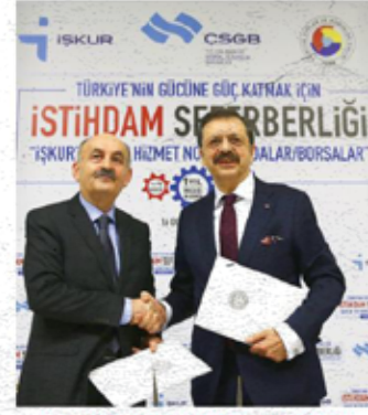
Oda ve Borsalarda İŞKUR Hizmet Noktası Kurulması Protokolü'nü Çalışma ve Sosyal Güvenlik Bakanı Mehmet Müezzinoğlu ile TOBB Başkanı Rifat Hisarcıklioğlu imzaladı.

ve borsalar, 81 il ve 160 ilçe'de, İŞKUR faaliyetleri hakkında da işverenleri bilgilendirecek ve tanıtacak. Program sonunda bu kişiyi istihdam etmeye devam edersen, SGK işveren payını İŞKUR ödüyor yine. Yani İŞKUR, senin istihdam üzerindeki yükünü azaltıyor. Bakın, babanın oğluna yapmayacağını, İŞKUR, özel sektörümüze yapıyor. Bize de bundan yararlanmak düşer" diye konuştu.