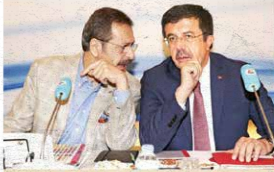
Ekonomi Bakanı Nihat Zeybekci, TOBB Müşterek Konsey Toplantısı'na katıldı.

İhracatta bu yıl tarihi rekor kırılacağına işaret eden Zeybekci, şunları söyledi: "İhracatımızın devamlı artması için sizinle konuşarak karar vereceğiz. İhracatta yüzde 11 seviyesinde artış hedefliyoruz. 2017 için 155 milyar dolar, 2018 yılı için de 170 milyar dolar hedefliyoruz" diye konuştu. Avrupa Birliği ile ilişkilerde nihai hedefin tam üyelik olduğunu belirten Zeybekci, Gümrük Birliği güncellenmesinin ekonomiye katkı sağlayacağını sözlerine ekledi.