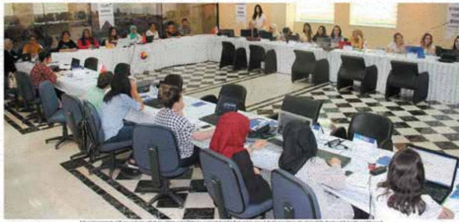
Başarılı olanlar Silikon Vadisi'ni görecek. Eğitimleri başarıyla tamamlayan kadınlar Silikon Vadisi'ni ziyaret etme fırsatını yakalayacak.

Kadın girişimciler, teknoloji alanındaki başarıları ile Silikon Vadisi'ni ziyaret etme fırsatını yakalayacak. Eğitimleri başarıyla tamamlayan kadınlar Silikon Vadisi'ni ziyaret etme fırsatını yakalayacak.