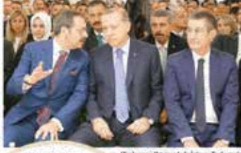
Uluslararası Yatırımcılarla İstişare Toplantısı'na çok sayıda yabancı şirket yöneticisi katıldı.

Erdoğan şöyle devam etti: "1. çeyrekteki yüzde 5'lik büyüme oranımız hepimize ümit vermiştir. Bu yıl da beklentilerin çok üzerinde bir büyüme oranıyla tamamlanacağına inanıyoruz. İhracatımız yüksekliğinizi sürdürüyor. İçtaledeki hem ekonomideki iyileşmeye paralel olarak hem de TOBB ile başlattığımız seferberlik sayesinde yeniden tek haneli rakamlara doğru gidiyoruz. Borsa İstanbul her gün yeni rekorlar kırıyor."