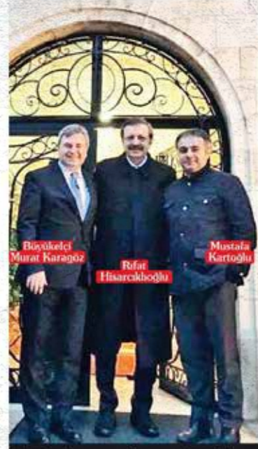
Türkiye'nin yeni Amman Büyükelçisi Murat Karagöz, ticari ilişkilerin de en büyük takipçisi.

Türk işadamları heyetini Ürdün Başbakanı Hani Al-Mulki tarafından da kabul edildi. TOBB Başkanı Rafat Hisarcıkhoğlu, Başbakan'ın "Irak ve Suriye'nin yeniden imarında birlikte çalışalım. Sizin inar ve inşa konusunda çok ilersiniz, biz de ilişkilerimizi değerlendiriz" sözlerini aktarıırken, "Bu Ürdün'ün Türkiye'yi tercihli ortak olarak gördüğünü ortaya koymasının yanında, Irak ve Suriye'de sorunların çözümlenmeye başlanacağına yönelik bir öngörü de gösteriyor" değerlendirmesinde bulundu. Ziyaretin en umutlandırıncı siyasi haberi buydu.