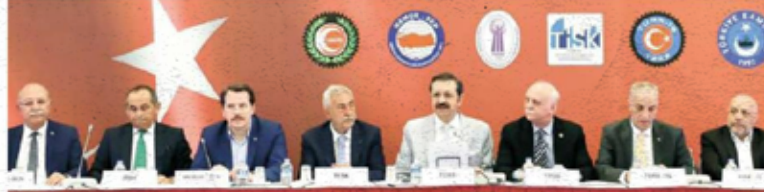
İşçi, memur, esnaf ve işveren kesimini kapsayan 8 sivil toplum kuruluşunun başkanları bir araya gelerek 15 Temmuz'un yıldönümünde, birlikte yeni bir atılım süreci başlatmak gerektiği mesajını verdi.

Hisarcıkloğlu, bir daha böyle girişimlerin yaşanmaması için FETÖ ile mücadelenin her alanda etkin ve kararlı şekilde sürdürülmesi gerektiğini belirterek "Yargı kurumları, darbecilere