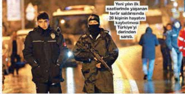
Yeni yılın ilk saatlerinde yaşanan terör saldırısında 39 kişinin hayatını kaybetmesi Türkiye'yi derinden sarstı.

Yeni yılın ilk dakikalarında yaşanan terör saldırısı tüm ülkede şok etkisi yaratırken, iş dünyasından birlik mesajı geldi. İşadamları ve sivil toplum kuruluşları birlik ve kardeşlik ile bu saldırıların üstesinden gelinebileceğini açıkladı.