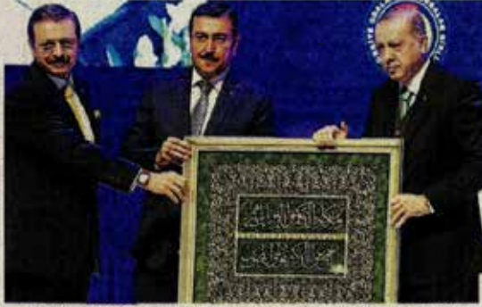
Genel Kurul'da TOBB Başkanı Rifat Hisarcıklioğlu (solda) ve Gümrük ve Ticaret Bakanı Bülent Tüfenkci (ortada), Cumhurbaşkanı Recep Tayyip Erdoğan'a (sağda) tablo hediye etti.

İstihdam seferberliğiyle rakamın 1 milyon 170 bine ulaştığını ifade eden Cumhurbaşkanı Erdoğan şöyle devam etti: "Gelecek bilgi temelli ekonomi üzerine kurulacak. Bunun için dijital dönüşümü, kurumsal kaliteyi, nitelikli işgücünü yakalamış bir altyapıyı tesis etmeliyiz. Bilişim, enerji, ulaştırma, lojistik ve ticaret alanlarında ülkemizi küresel cazibe merkezi haline getirmeliyiz."