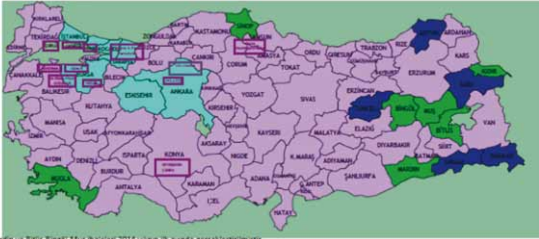
Şekil 4: Doğal gaz dağıtımının sağlandığı iller

Mardin ve Bitlis-Bingöl-Muş ihaleleri 2014 yılının ilk ayında gerçekleştirilmiştir.