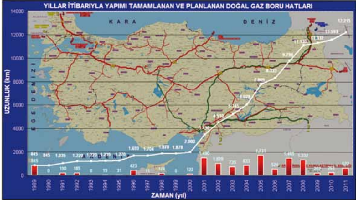
Şekil 3: BOTAŞ İletim Şebekesi

BOTAŞ'ın 2013 yılı sonu itibariyle işletmekte olduğu doğal gaz iletim şebekesinde yer alan yüksek basınçlı boru hatlarının uzunluğu yaklaşık olarak 12.900 km'ye ulaşmıştır. Bu hatlar üzerinden gaz sevkiyatı 8 adet kompresör istasyonu ile gerçekleştirilmektedir.